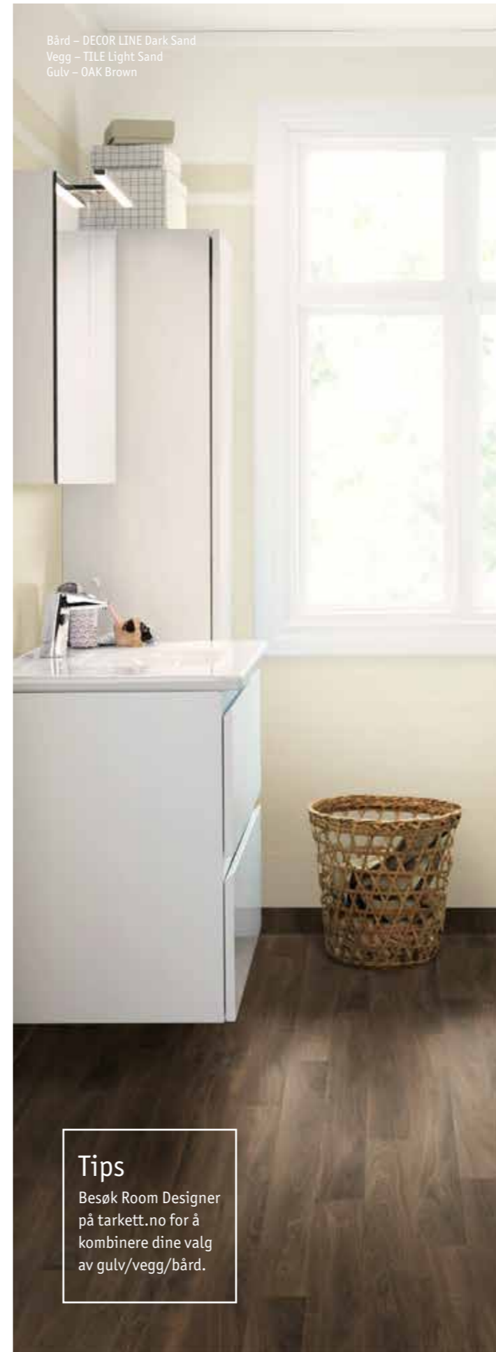
Bård – DECOR LINE Dark Sand Vegg – TILE Light Sand Gulv – OAK Brown

Tips Besøk Room Designer på tarkett.no for å kombinere dine valg av gulv/vegg/bård.