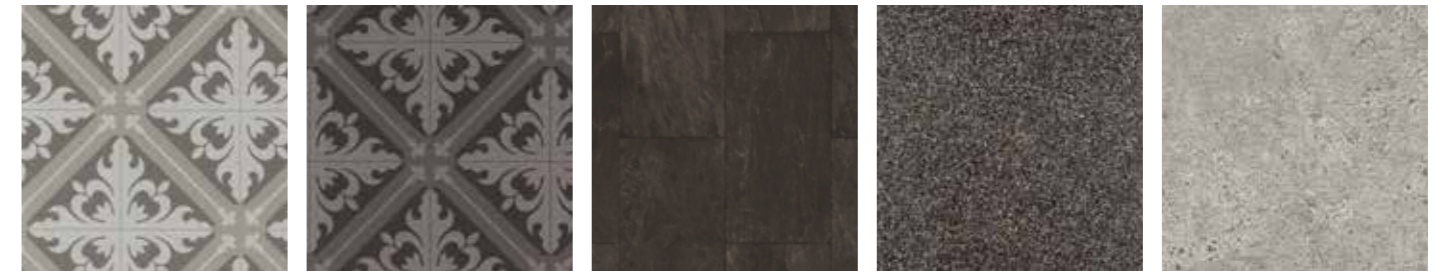
ISTANBUL Medium Grey 2455 4001 ISTANBUL Dark Grey 2455 4002 AUTHENTIC SLATE Black 5619 035 MODA Black 5715 011 ROCK Grey Black 5619 020