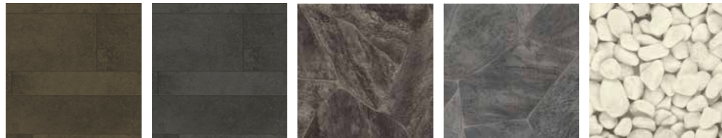
VARIATA Brown 2590 5152 VARIATA Black 2590 5151 SKIFFER Anthracite 2590 5134 SKIFFER Dark Grey 2590 5132 PEBBLE Light Grey 2590 5154