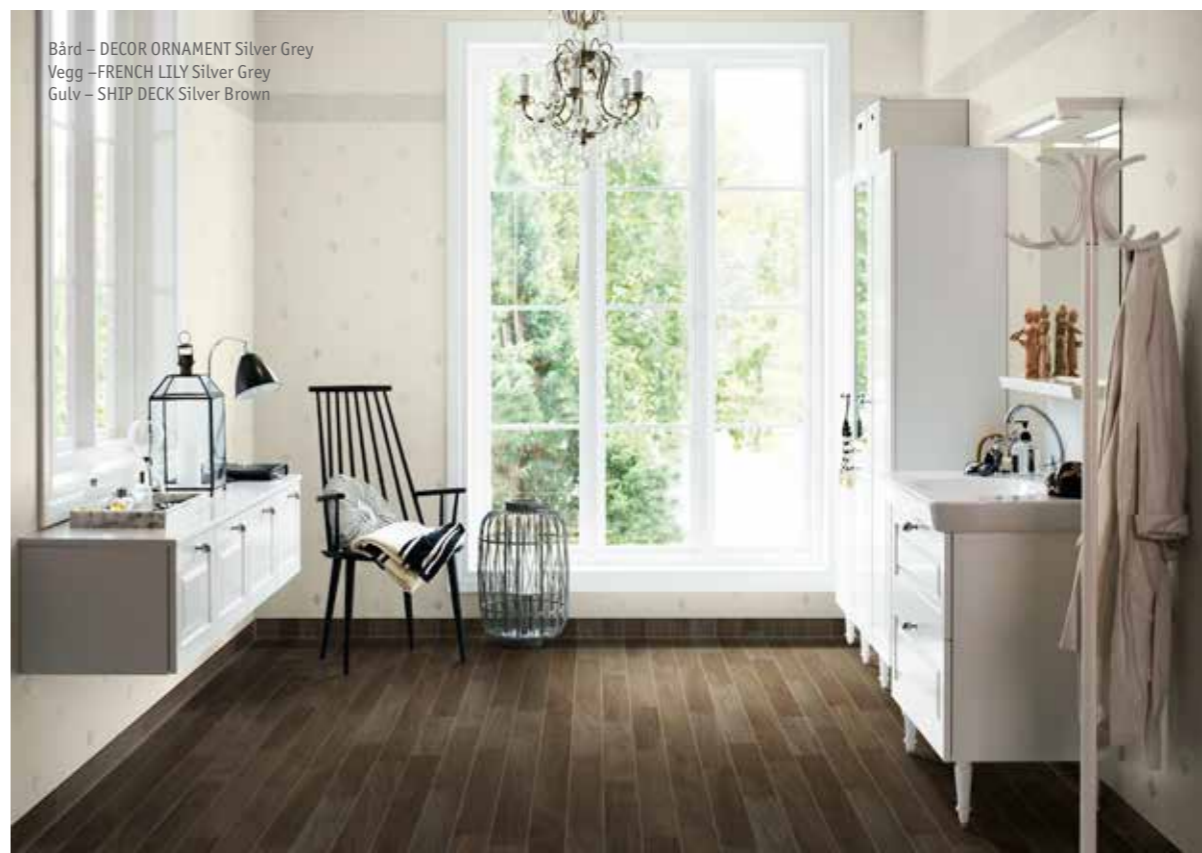
Bård – DECOR ORNAMENT Silver Grey Vegg – FRENCH LILY Silver Grey Gulv – SHIP DECK Silver Brown

Aquarelle er et utmerket valg til badet som i tillegg er veldig lettstelt. Gulv og vegger rengjøres enkelt med en myk svamp, lunkent vann og litt universalt rengjøringsmiddel, og tørkes raskt over med en nal. At gulvet i tillegg trekkes et stykke opp på veggen gjør at du får maksimal beskyttelse mot fukt.