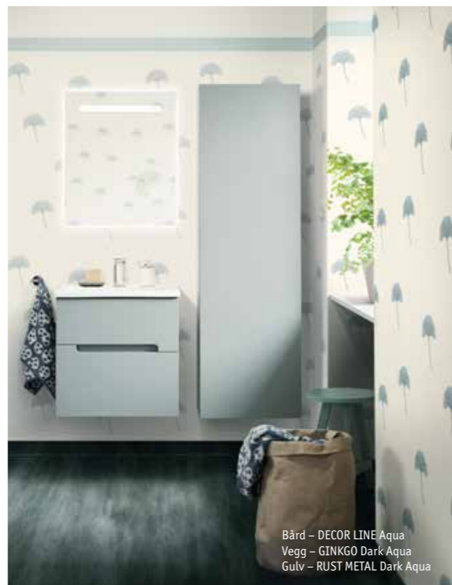
Bård – DECOR LINE Aqua Vegg – GINKGO Dark Aqua Gulv – RUST METAL Dark Aqua

Vaskerommet blir sjeldent prioritert i våre hjem, sannsynligvis fordi vi sjeldent viser det frem til gjester. Likevel er det et rom hvor vi bruker en del tid. Aquarelle-kolleksjonen gjør det enkelt å skape en vakker og trivelig atmosfære når man må vaske eller stryke klær. Gulv som er myke, gode og varme å gå på øker trivselen, og gulvets vanntetthet føles trygt i et rom som ofte må tåle tøffe tak.