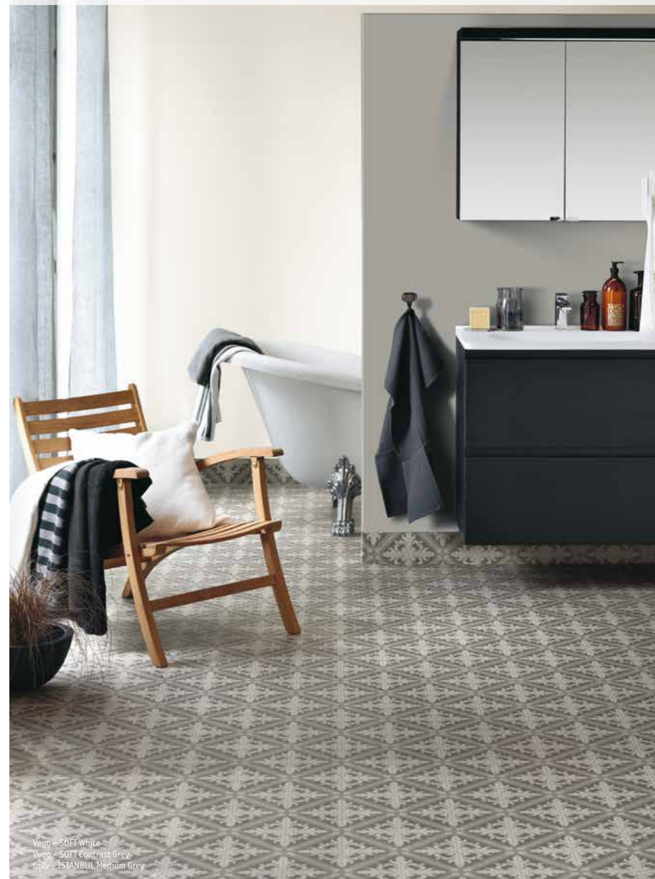
Vegg – SOFT White Vegg – SOFT Contrast Grey Gulv – ISTANBUL Medium Grey

Med fondvegger i avvikende mønstre eller farger kan man skape et spennende miljø. Bildene i denne brosjyren viser mange eksempler på dette. Ved installasjonen monteres grunnveggen oftest rundt hjørnet og 10 cm inn på fondveggsiden. Deretter monteres fondveggen slik at den slutter inne i hjørnet, og deretter tettes skjøten med Aqua-Tett. Fondveggen skal ikke plasseres i våtsone 1, dvs i området der du dusjer/bader.