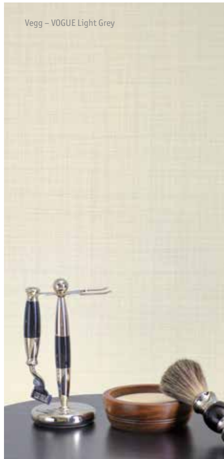
Vegg – VOGUE Light Grey