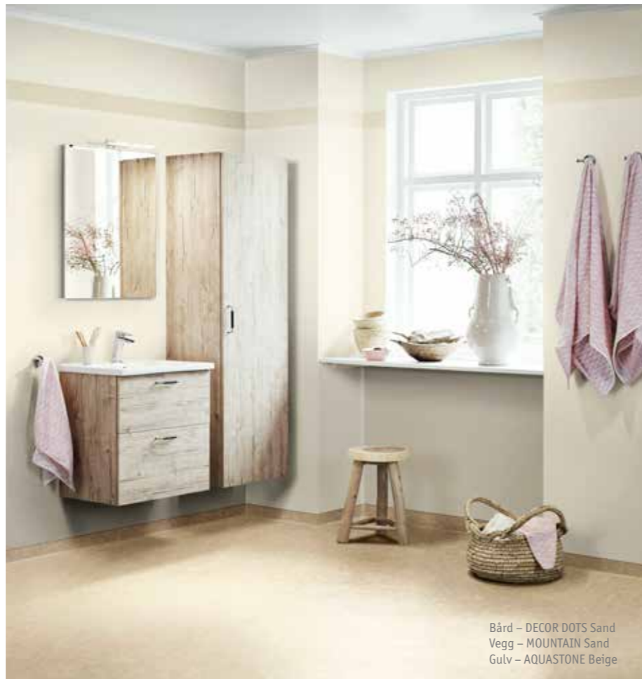
Bård – DECOR DOTS Sand Vegg – MOUNTAIN Sand Gulv – AQUASTONE Beige