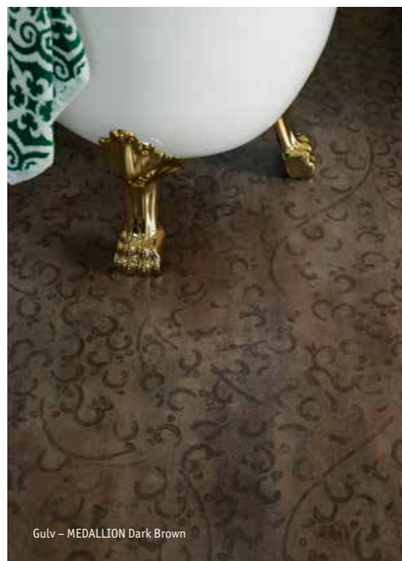
Gulv – MEDALLION Dark Brown

Trykket på vårt veggbelegg "French Lily" varierer i fargestyrke. Noen liljer er mer fremtredende enn andre for å gi følelsen av et håndtrykket mønster.