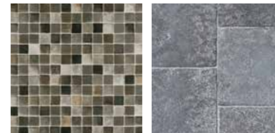
SARONDO Black 5619 037 SELENE Black 5619 036