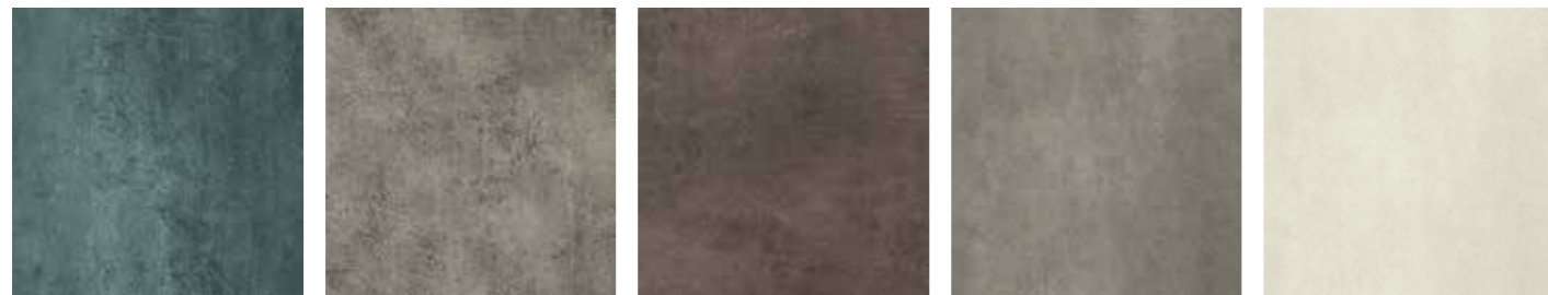
RUST METAL Dark Aqua 2590 5158 KIRUMA Aluminium 2590 5146 KIRUMA Dark Grey 2590 5031 RAW CONCRETE Dark Grey 2590 5136 RAW CONCRETE Medium Grey 2590 5135