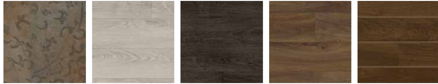
MEDALLION Dark Brown 2590 5137 OAK Grey 2590 5147 OAK Black 2590 5038 OAK Brown 2590 5153 SHIP DECK Silver Brown 2590 5159

Gulvene finnes i to forskjellige utførelser: størst mønster og fargevalg finnes på 2 meters bredde . 2 m gulvene er ftalatfrie.