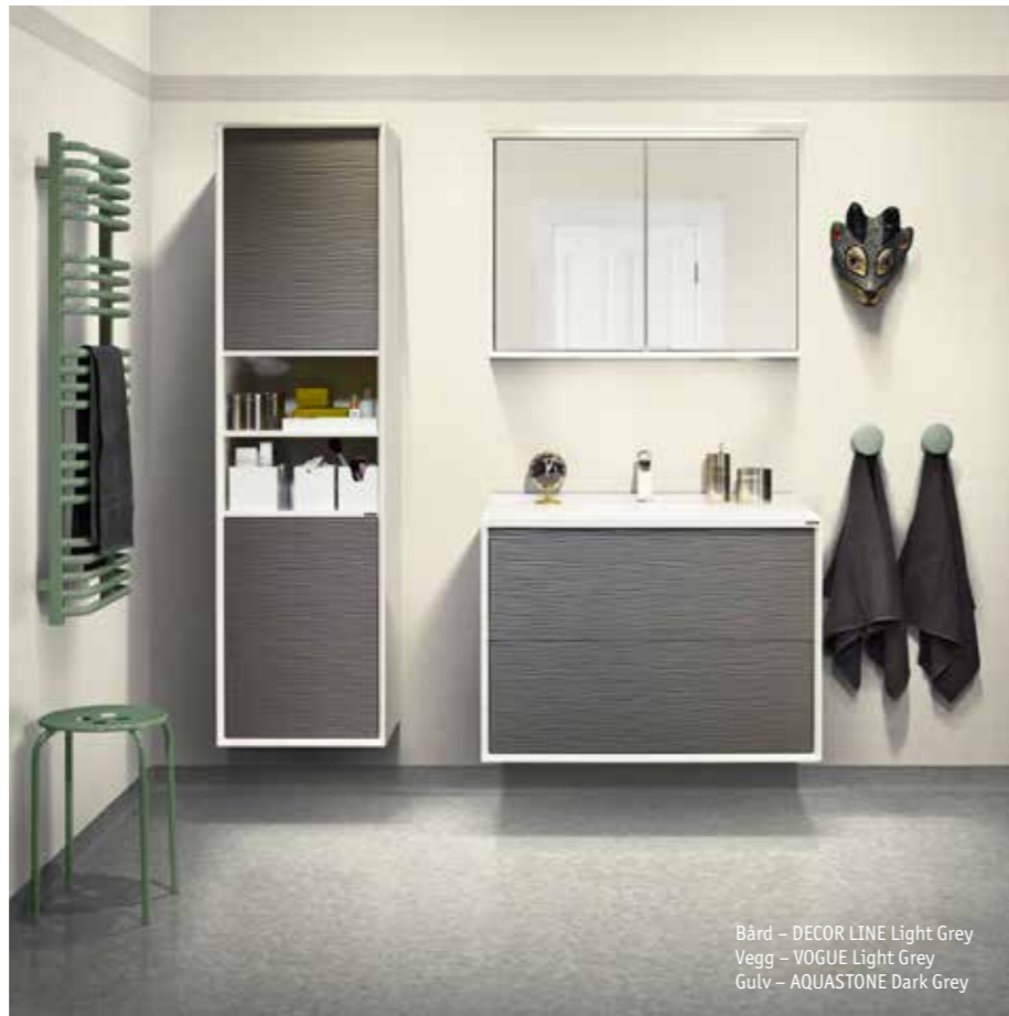
Bård – DECOR LINE Dark Sand Vegg – VOGUE Light Grey Gulv – AQUASTONE Dark Grey