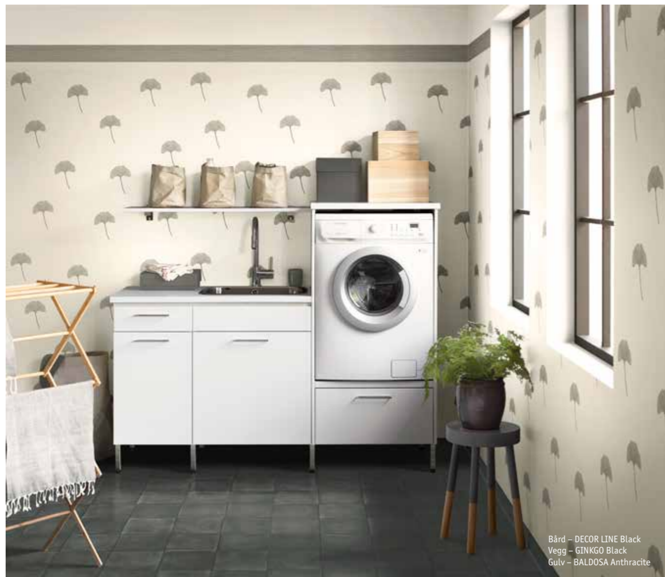
Bård – DECOR LINE Black Vegg – GINKGO Black Gulv – BALDOSA Anthracite