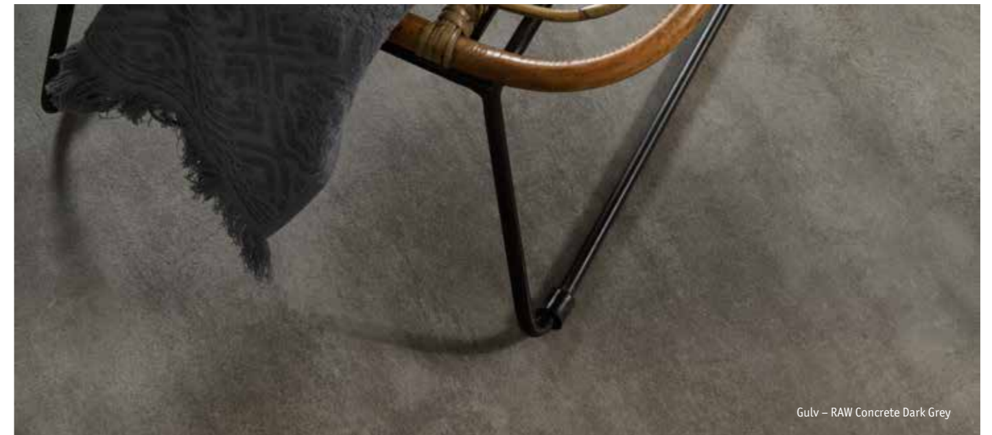
Gulv – RAW Concrete Dark Grey