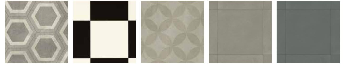
HONEYCOMB TILE Grey 2455 4009 SQUARE Black & White 2455 4003 CIRCLE FLOWER Grey 2455 4010 BALDOSA Graphite 2455 4006 BALDOSA Anthracite 2455 4007

Aquarelle-gulv finnes også i 3 meters bredde , og kan dermed installeres på større bad uten skjøl. For å kunne produsere kolleksjonens fine mønster er beleggets konstruksjon forsterket med glassfiber. Å installere et gulv med glassfiber stiller høyere krav til jevnt underlag og legging. Følg derfor leggeanvisningen på tarkett.no. 3 meters gulvet inneholder gjenvunnet materiale og kan derfor inneholde spor av ftalater.