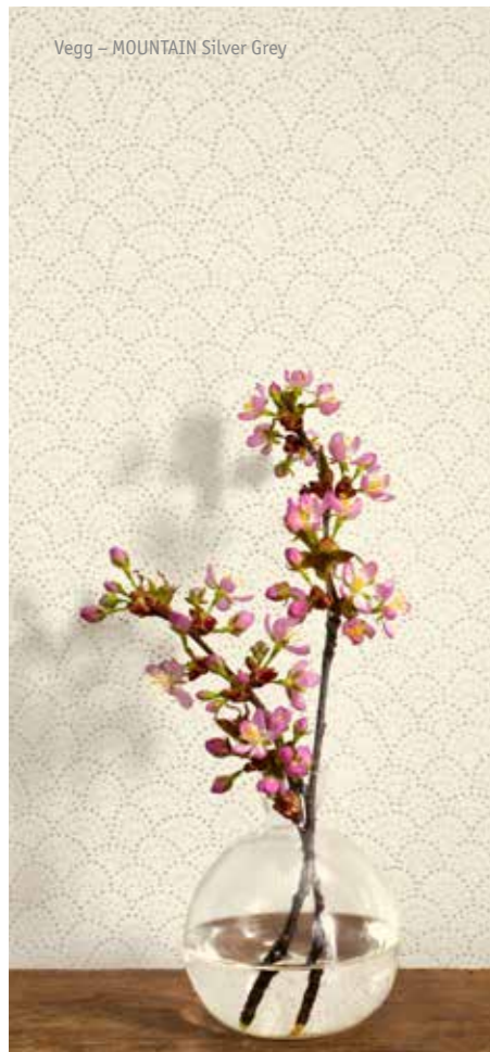
Vegg – MOUNTAIN Silver Grey