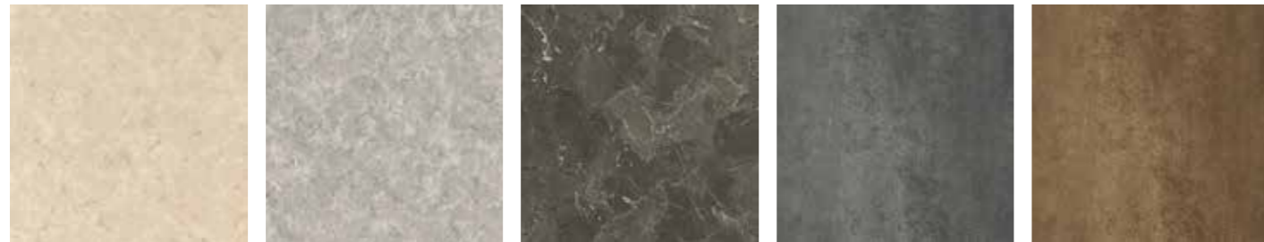
AQUASTONE Beige 2590 5142 AQUASTONE Dark Grey 2590 5014 ROYAL MARBLE Black 2590 5155 RUST METAL Graphite 2590 5156 RUST METAL Dark Copper 2590 5157